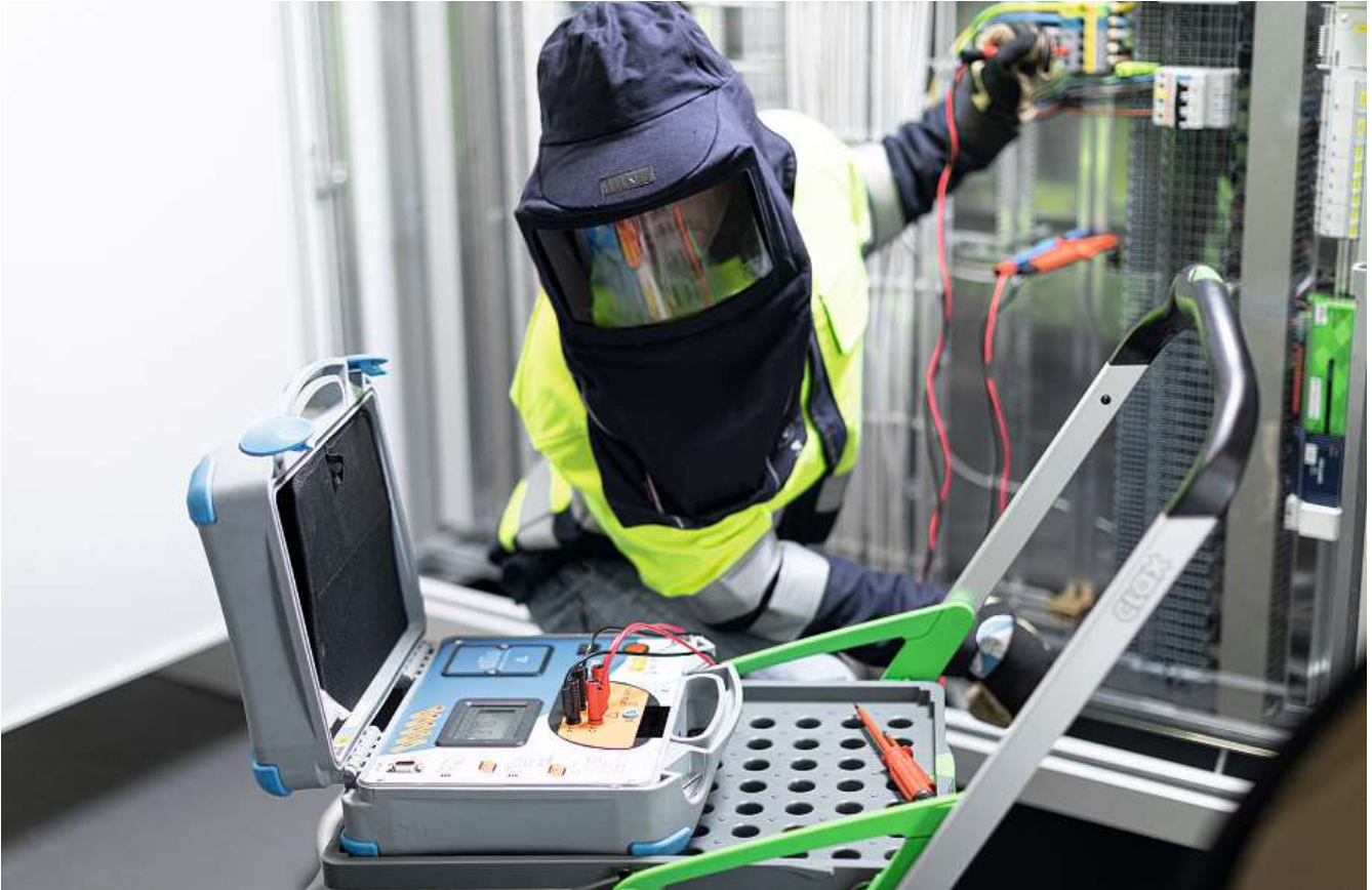
Fachgerechte Kontrolle der elektrischen Installationen.