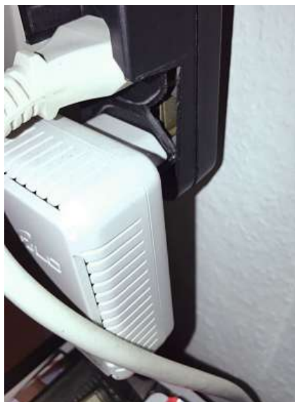
Defekte Steckdosenleiste in einem Kinderzimmer.

den-Betrieb unterbrochen, kann das hohe Kosten zur Folge haben: Einerseits, weil die entsprechenden Produktionsteile nicht mehr hergestellt werden können, andererseits aber auch, weil Mitarbeiterinnen und Mitarbeiter während des Ausfalls nicht produktiv arbeiten können.