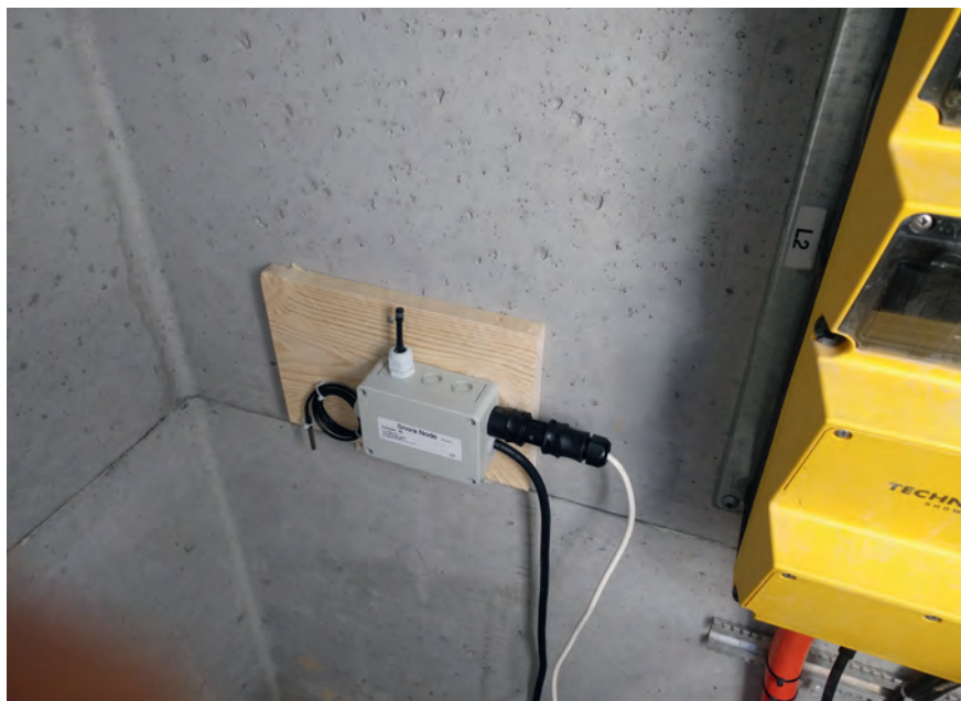
Bezüglich Installation ist Snora flexibel.

Dies führte zum Projekt «Snora», einem vernetzten System für die Steuerung von Elektroheizungen. Der Begriff Snora setzt sich zusammen aus: «Snow» und dem «Lora»-Netzwerk (Long Range Wide Area Network), einem Low-Power-Wireless-Netzwerkprotokoll, das für Kommunikation im Internet der Dinge entwickelt wurde.