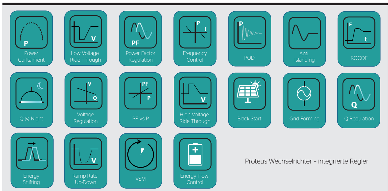
Aktueller Funktionsumfang des Proteus-Wechselrichters.

Um die technisch bedingten kapazitiven (Kabel) oder induktiven (Trafo) Verluste zu verringern, können PV-Wechselrichter auch nachts Blindleistung erzeugen (Q@night). Diese Verluste können auch komplett vermieden werden, wenn diese Funktion beispielsweise durch einen kleinen, lokalen Speicher gepuffert wird. Dann