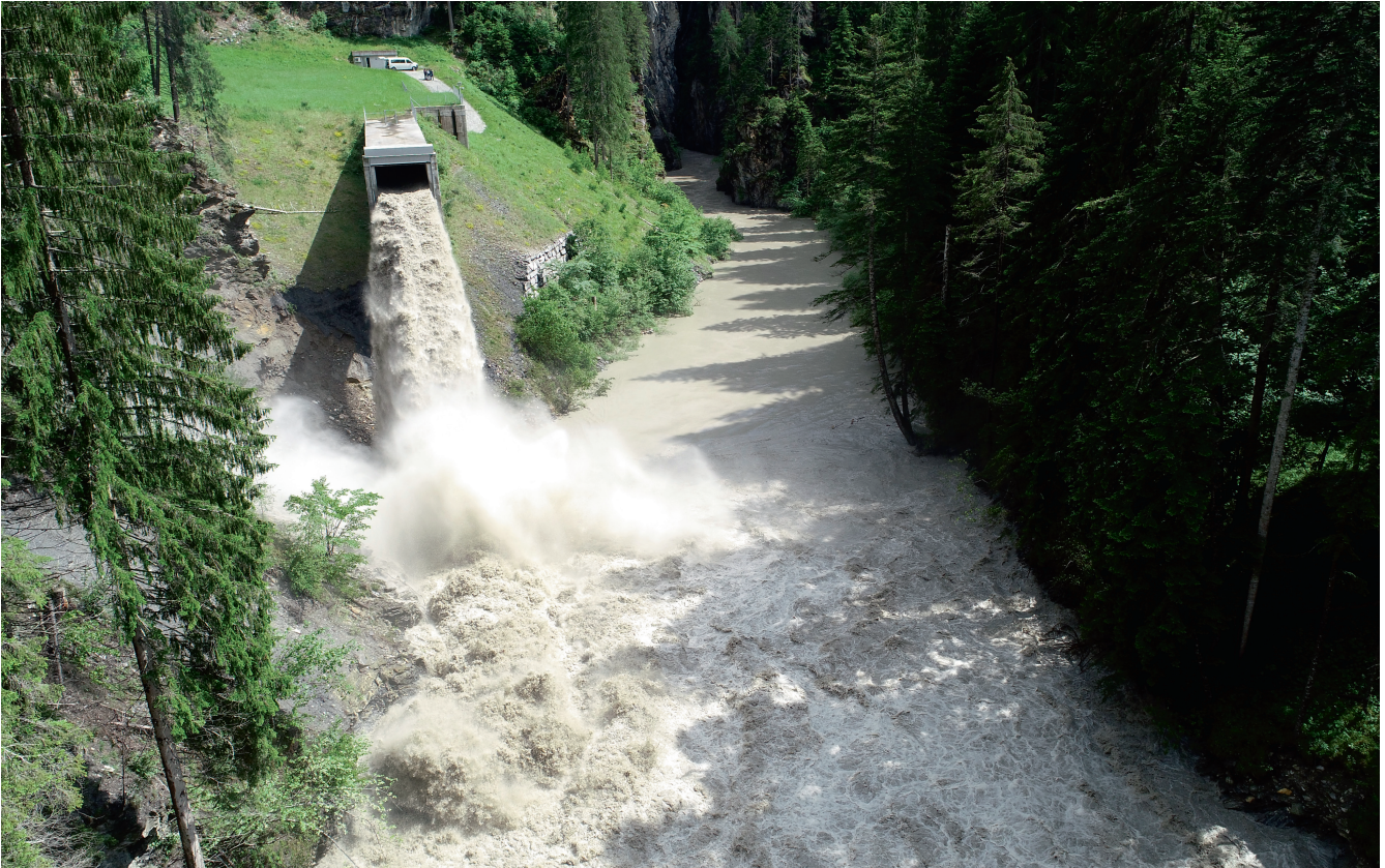
Über den Umleitstollen gelangen Sedimente zurück in die Albula.