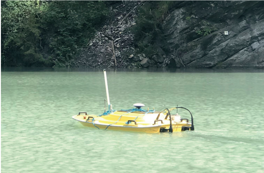
Ein ferngesteuertes Boot mit Messgeräten u.a. für die Erfassung der Höhe des Stauseebodens und der Strömungsgeschwindigkeiten, das vom VAW-Forschungsteam auf dem Solis-Stausee eingesetzt wurde.

men zu erhöhen und damit das durch Sedimente verloren gegangene Wasservolumen zu kompensieren. Dies geschah beispielsweise 1989/91 beim Lac de Mauvoisin (VS). Bei Neuanlagen kann es günstig sein, diese in Nebentälern zu bauen und das Wasser des Hauptgewässers zu fassen und erst nach einer Entsandung beizuleiten. Somit können Sedimente effizient vom Stausee ferngehalten werden.