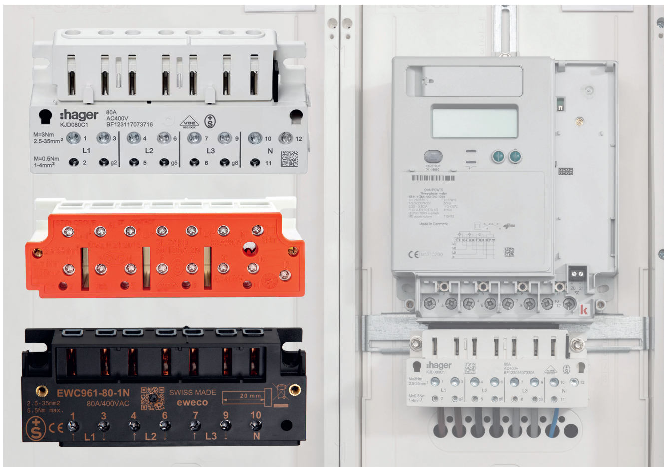
Zählerklemmen der Hersteller Hager, Seidl und Eweco (von oben nach unten).